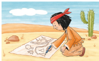
Du arbeitest sorgfältig und genau – super!

Jeden Tag ein dickes Lob für dich! Du darfst es ausschneiden.