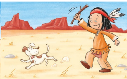
Du hast viel Neues gelernt. Zeit, mal wieder spielen zu gehen!