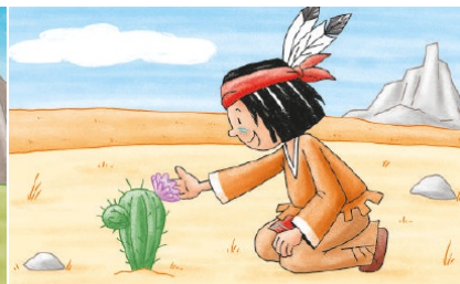
Du kommst mit viel Geduld ans Ziel!