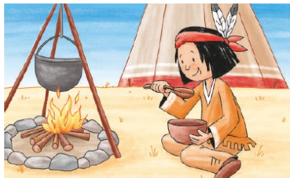
Du hast dir eine Stärkung verdient!

Jeden Tag ein dickes Lob für dich! Du darfst es ausschneiden.