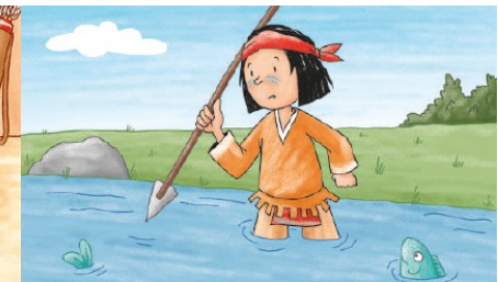
Du strengst dich an, um an dein Ziel zu kommen. Sehr gut!