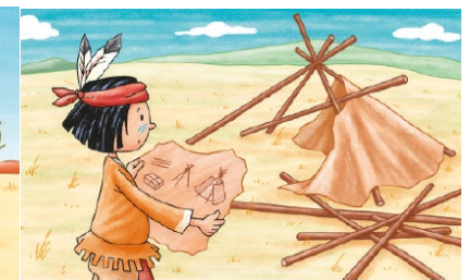
Arbeite weiter planvoll und überlege gut!