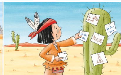
Du hast fleißig geübt. Glückwunsch!