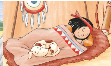
Alles geschafft! Jetzt hast du dir eine Ruhepause verdient.