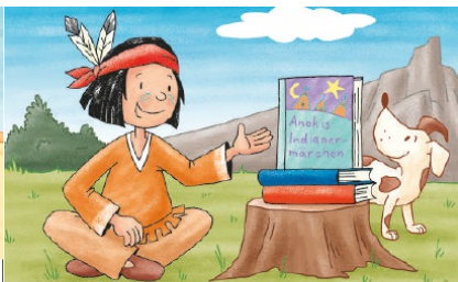
Du hast fleißig lesen geübt. Glückwunsch.